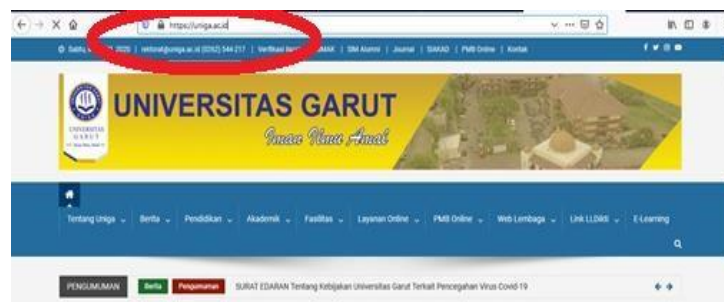
Gambar.2 Tampilan Website Uniga

Setelah Browser Terbuka silahkan ketik https://uniga.ac.id/ di address bar