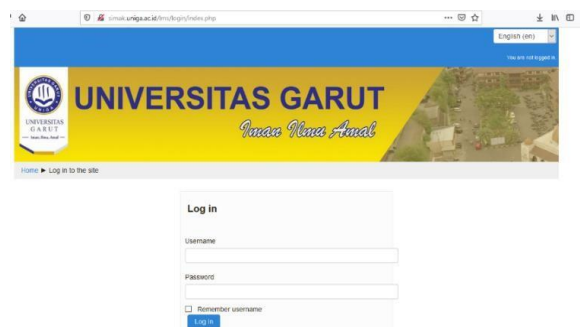
Gambar.5 Login “E-Learning”

Setelah itu ketikkan username/nama pengguna dan juga password/kata sandi .