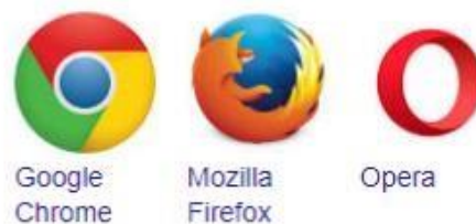
Gambar.1 Icon Aplikasi Browser

Pertama buka dahulu aplikasi browsernya seperti google chrome, firefox,dll.