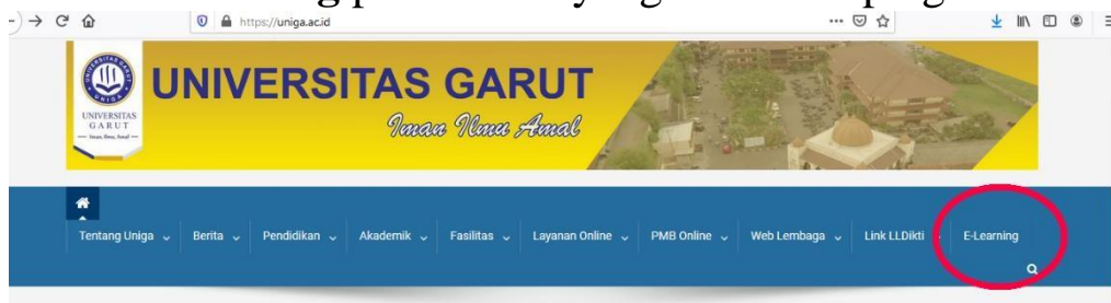
Gambar.3 Pilih Menu “E-Learning”

Pilih E-Learning pada Menu yang ada disamping atas kanan.